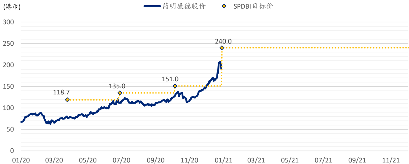
图表 3: 浦银国际目标价: 药明康德