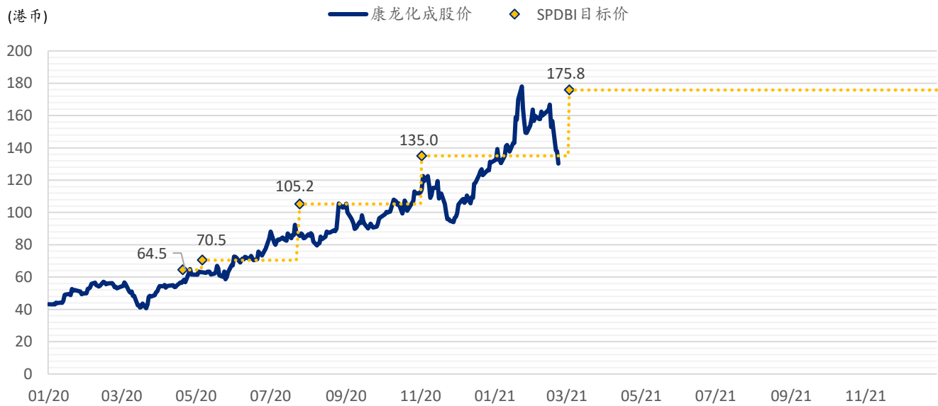
图表 3: 浦银国际目标价: 康龙化成