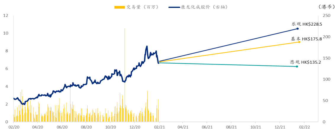
图表 6: 康龙化成 SPDBI 情景假设

注：股价截至 2021 年 2 月 24 日