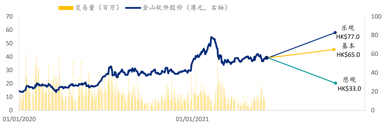
图表 7: 金山软件 SPDBI 情景假设