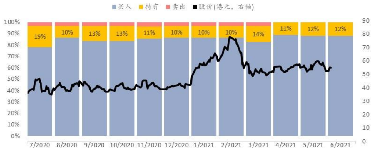
图表 6: 金山软件市场普遍预期