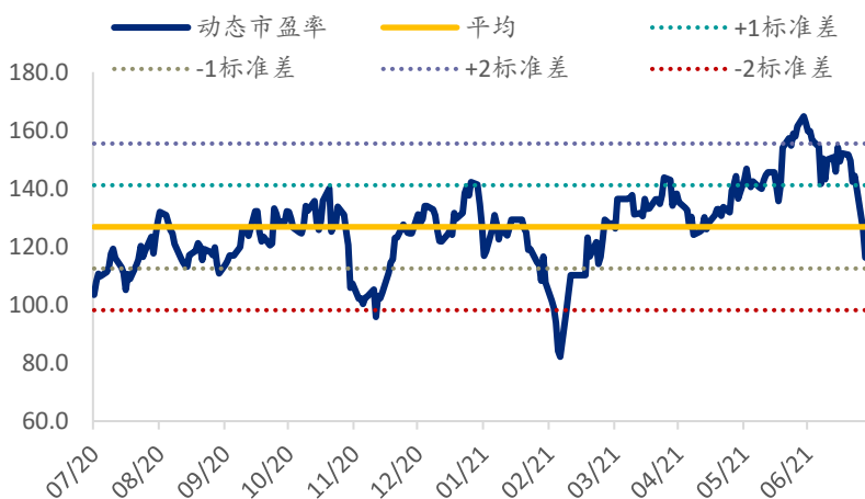
图表 1：药明生物 PE Band

我们重申对公司“买入”评级，长期看好 CRO 行业和药明生物作为国内大分子药物 CRO/CDMO 的龙头地位。上半年净利润增长 135% 以上，COVID-19 项目发展迅速，远超市场预期。