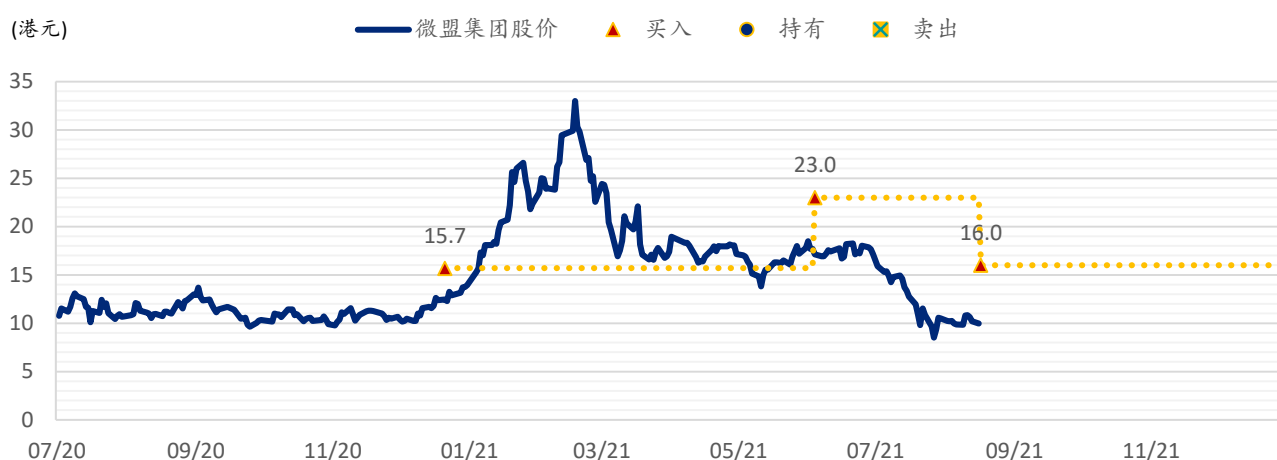
图表 3: SPDBI 目标价: 微盟集团