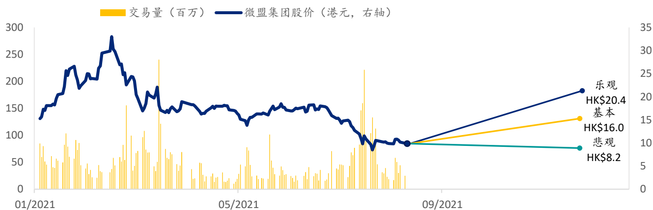
图表 6: 微盟集团 SPDBI 情景假设