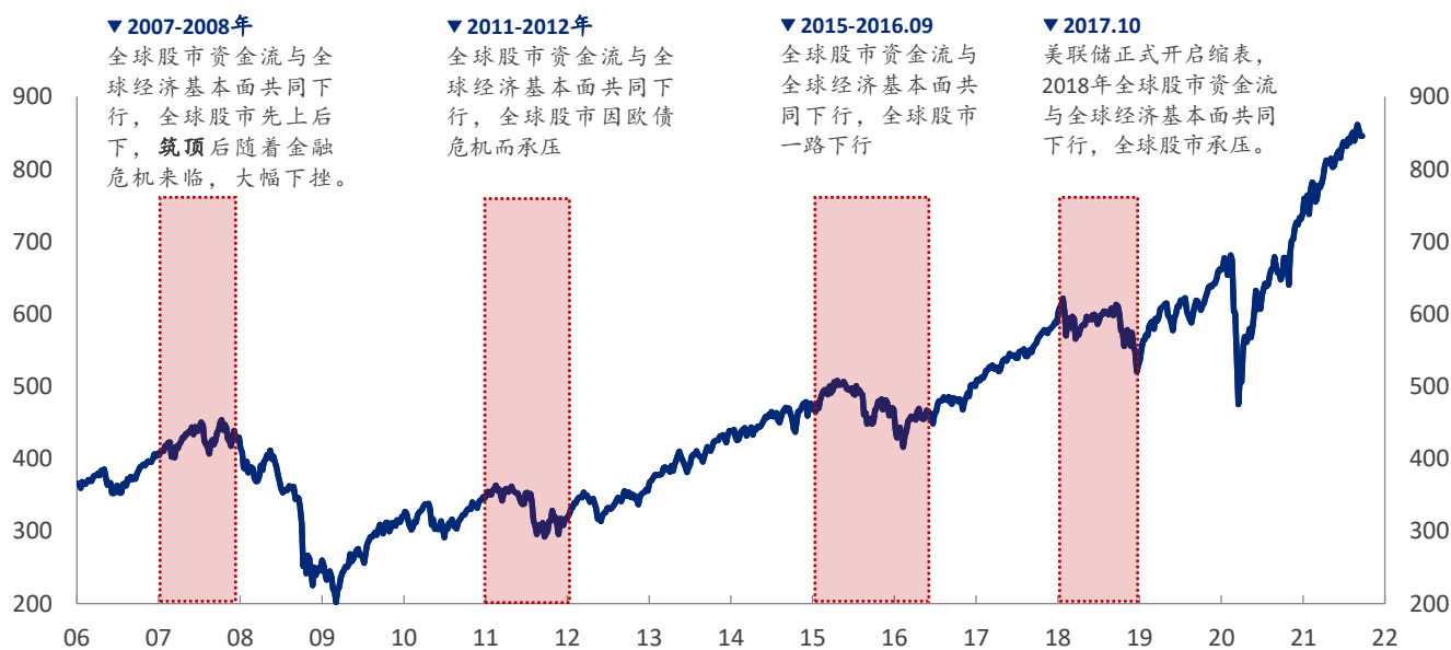
图表 2: MSCI AC 全球指数

我们观察图表不难发现，全球股市资金流动能筑顶通常领先于经济基本面（以全球 PMI 为例）筑顶，一旦全球股市资金流与全球经济基本面共同下行，包括中国股市在内的全球股市通常承压，过去 10 几年的历史中无一例外。至此关键时点，我们再度重申我们在《 缩减 QE 日益临近，对风险资产继续保持谨慎——见微知著 》中的观点，再度呼吁投资人，整体的风险资产敞口适度，继续维持防御，以为之后的波动未雨绸缪。