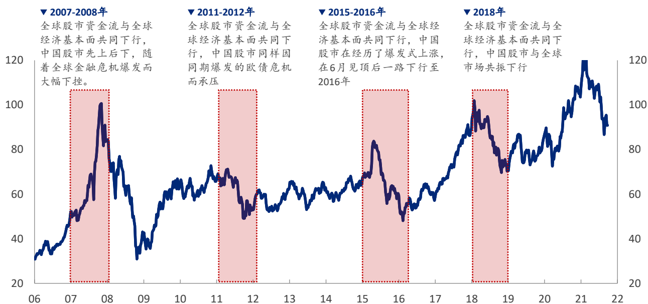
图表 3: MSCI 中国指数