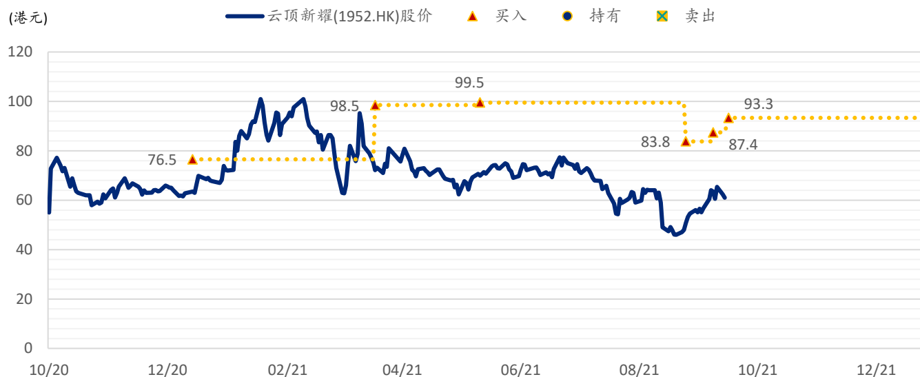
图表 5: 浦银国际目标价: 云顶新耀