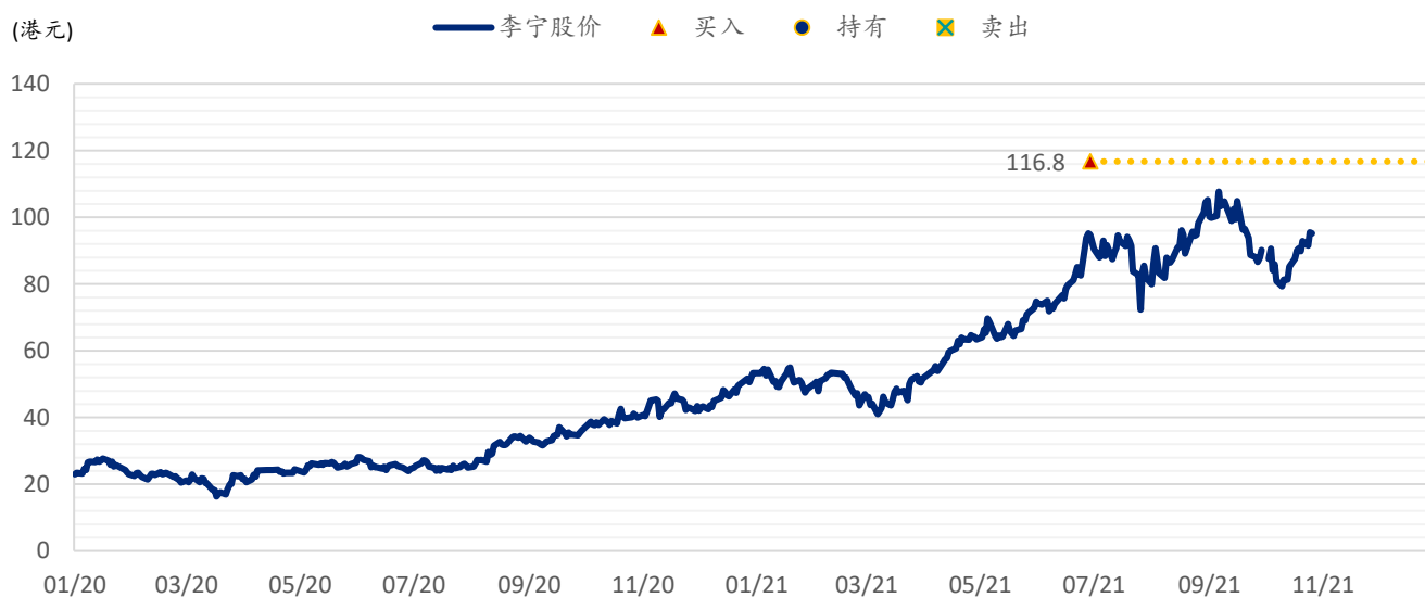
图表 5: SPDBI 目标价: 李宁