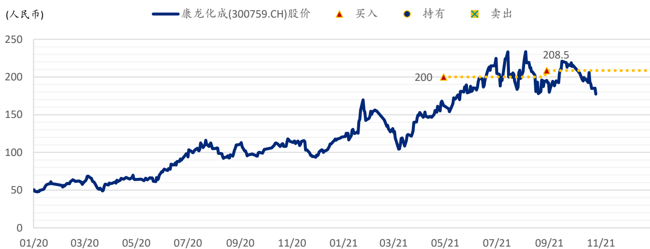
图表 4: 浦银国际目标价: 康龙化成 A 股 (300759.CH)