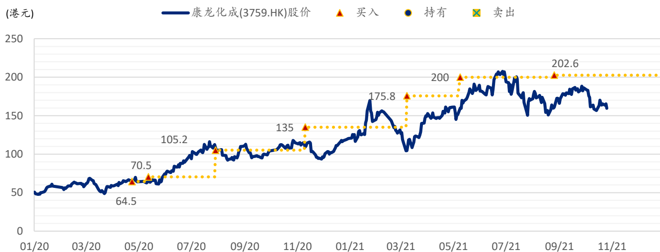
图表 3: 浦银国际目标价: 康龙化成港股 (3759.HK)