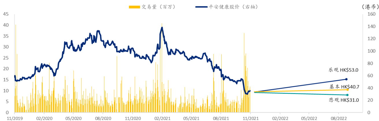
图表 8: 平安健康 SPDBI 情景假设

注: 股价截至 2021 年 11 月 16 日 资料来源: Bloomberg、浦银国际