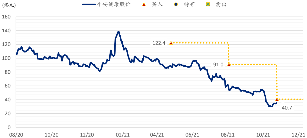
图表 5: SPDBI 目标价: 平安健康