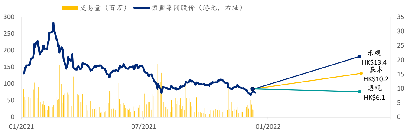
图表 7: 微盟集团 SPDBI 情景假设