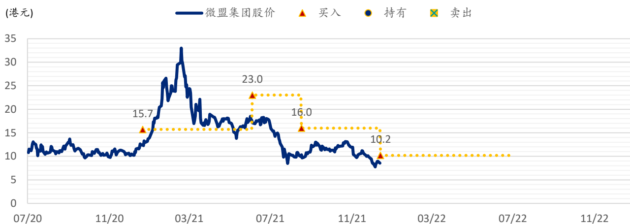
图表 4: SPDBI 目标价: 微盟集团