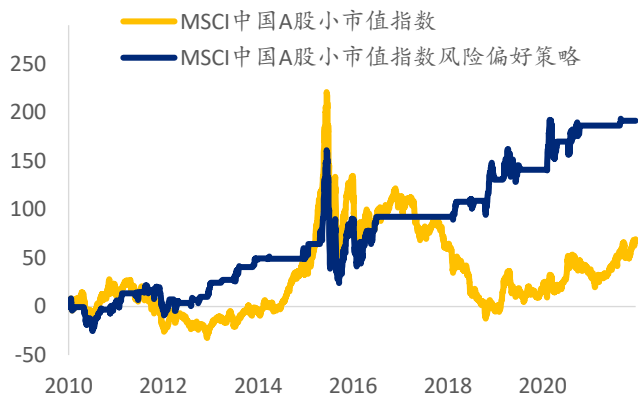
图表 4: MSCI 中国 A 股小市值指数风险偏好策略 累计收益 (%)