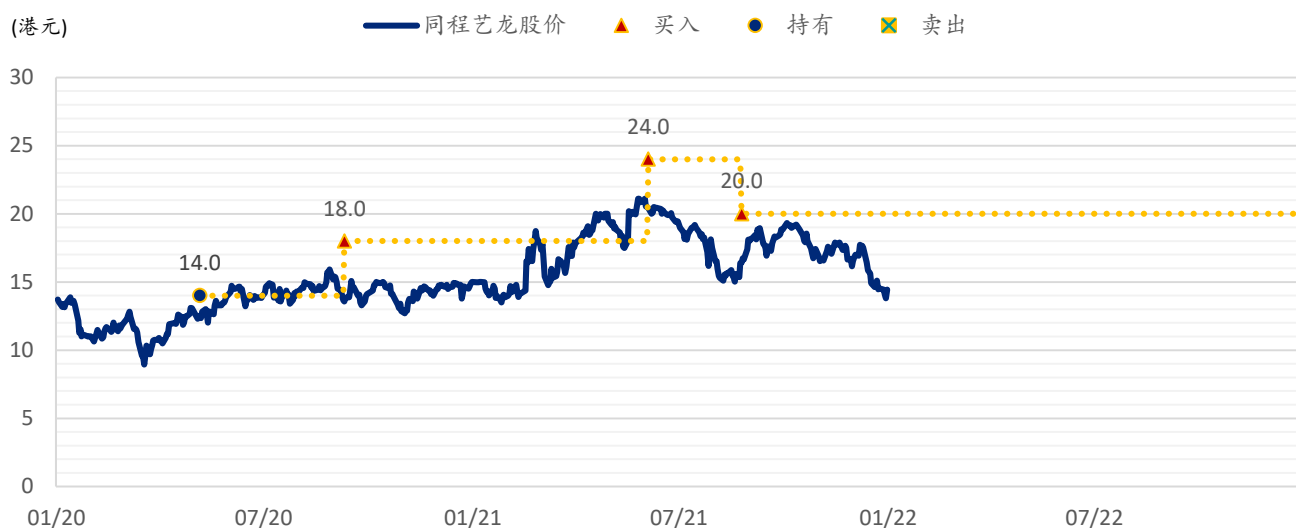
图表 1: 浦银国际目标价: 同程旅行