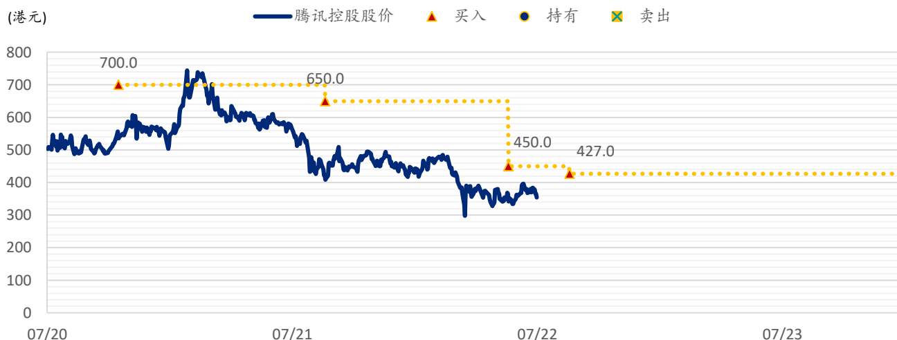
图表 4: SPDBI 目标价: 腾讯