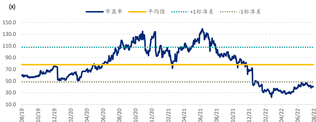
图表 3: 药明生物 PE Band