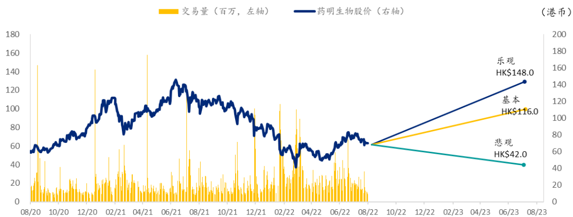
图表 7: 药明生物 SPDBI 情景假设