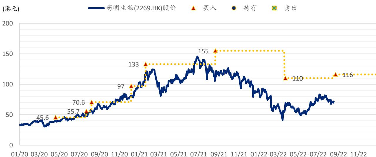
图表 4: 浦银国际目标价: 药明生物