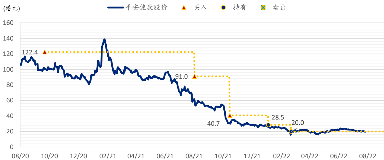
图表 2: SPDBI 目标价: 平安健康