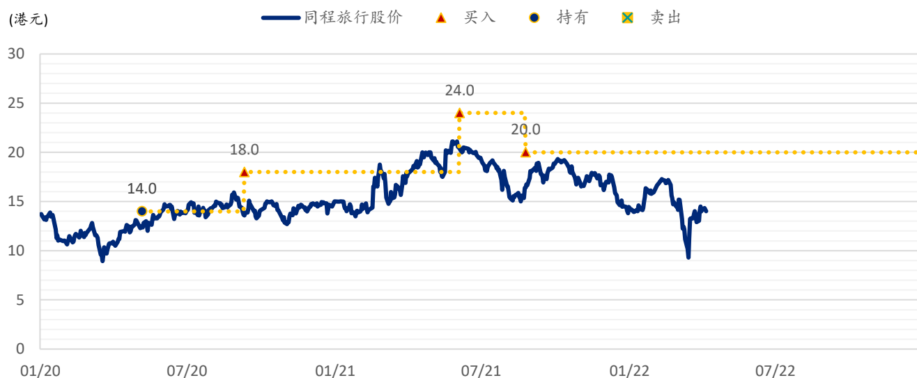
图表 2: 浦银国际目标价: 同程旅行(780.HK)

注: 截至 2022 年 8 月 22 日收盘价