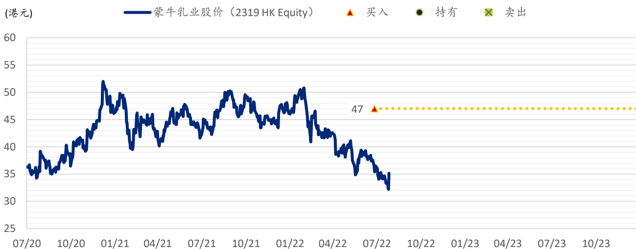
图表 6: SPDBI 目标价: 蒙牛乳业

注: 截至 2022 年 8 月 25 日收盘价; 资料来源: Bloomberg、浦银国际