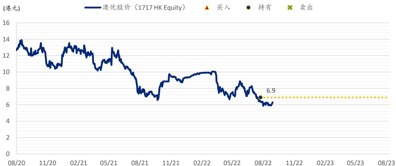
图表 2: SPDBI 目标价: 澳优

注: 数据截至 2022 年 8 月 31 日