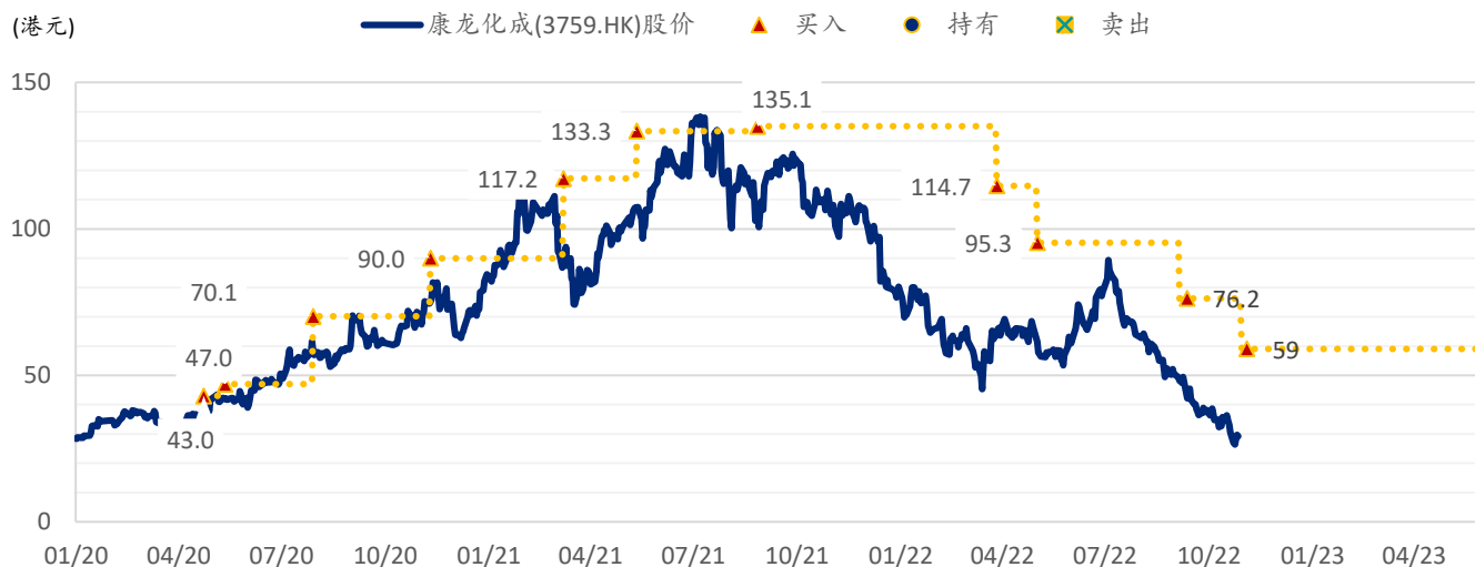
图表 5：浦银国际目标价：康龙化成港股 (3759.HK)