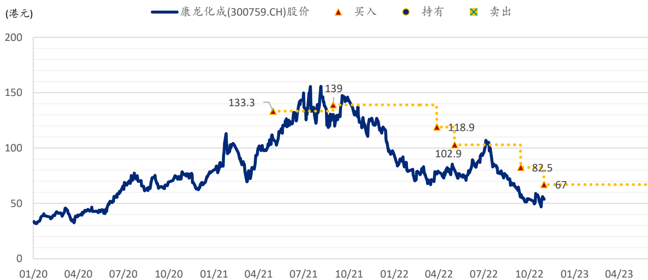
图表 6：浦银国际目标价：康龙化成 A 股 (300759.CH)