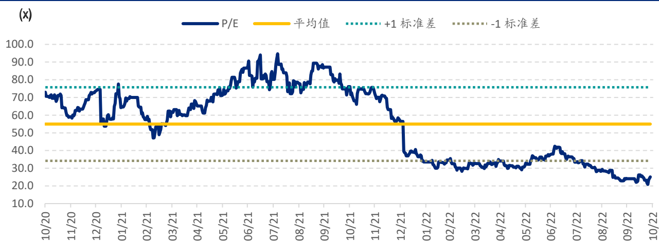
图表 4: 康龙化成 A 股 (300759.CH) PE Band