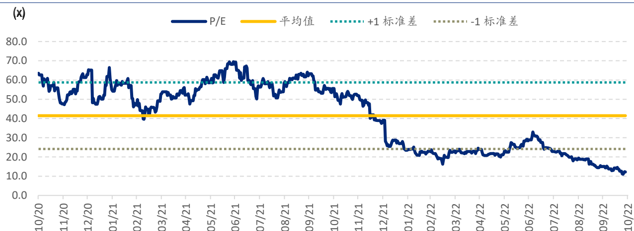
图表 3: 康龙化成港股 (3759.HK) PE Band