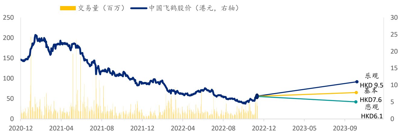
图表 5：中国飞鹤 SPDBI 情景假设