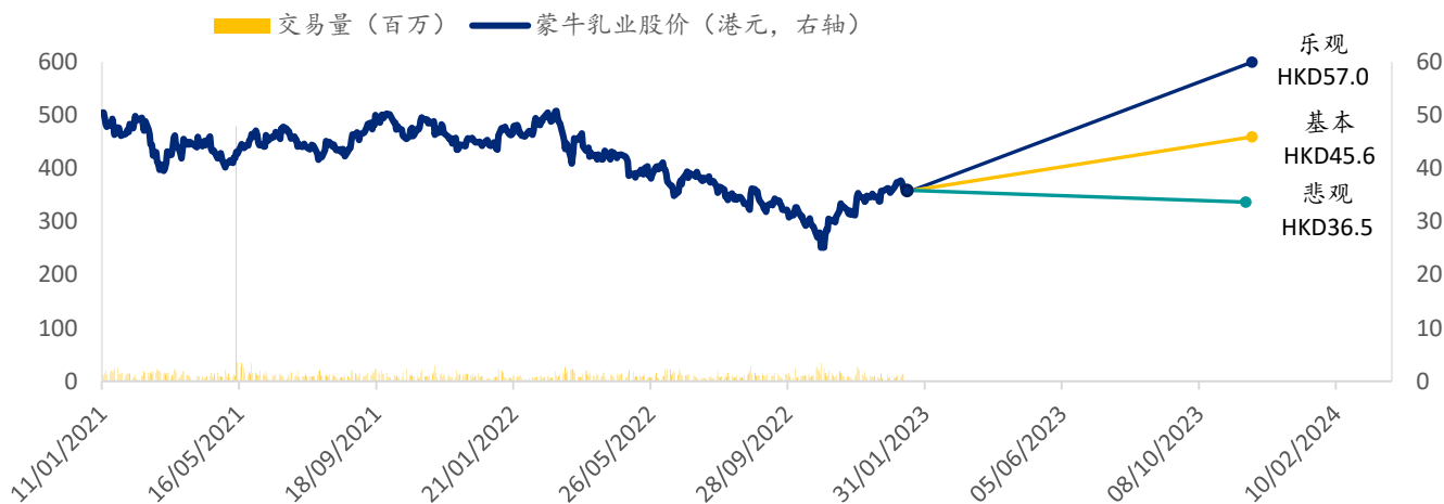
图表 6: 蒙牛乳业 SPDBI 情景假设