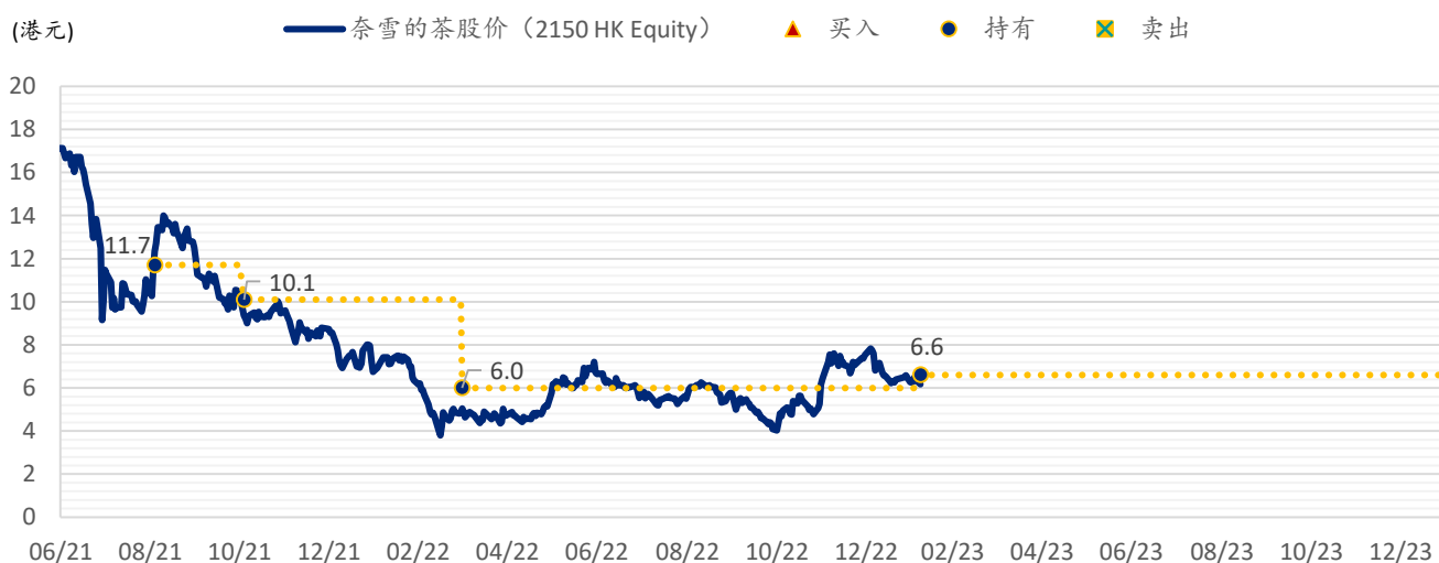
图表 3: SPDBI 目标价: 奈雪的茶