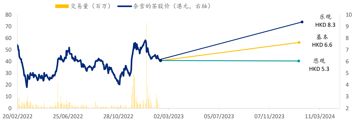
图表 6: 奈雪的茶 SPDBI 情景假设