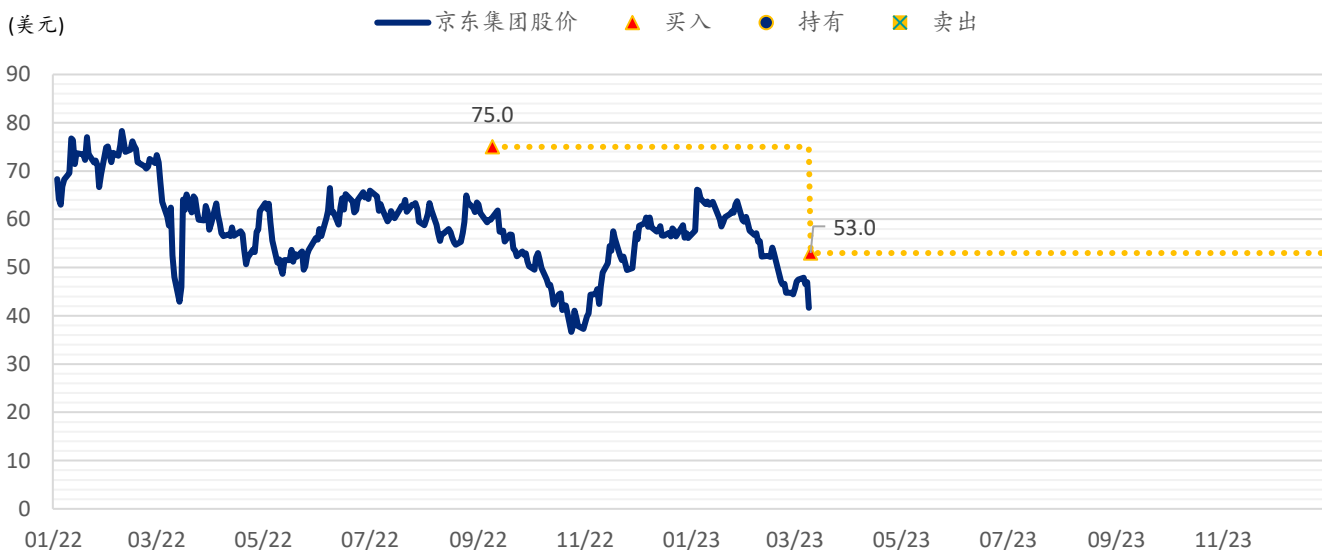
图表 3：浦银国际目标价：京东（JD.US）

注：截至 2023 年 3 月 9 日收盘