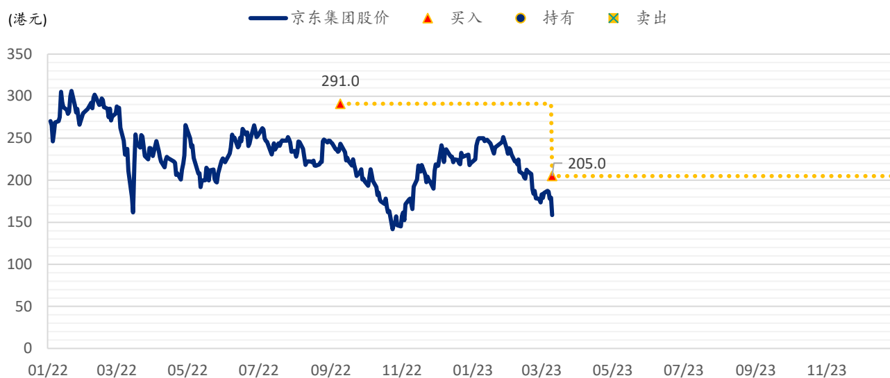
图表 2：浦银国际目标价：京东（9618.HK）

注：截至 2023 年 3 月 10 日收盘