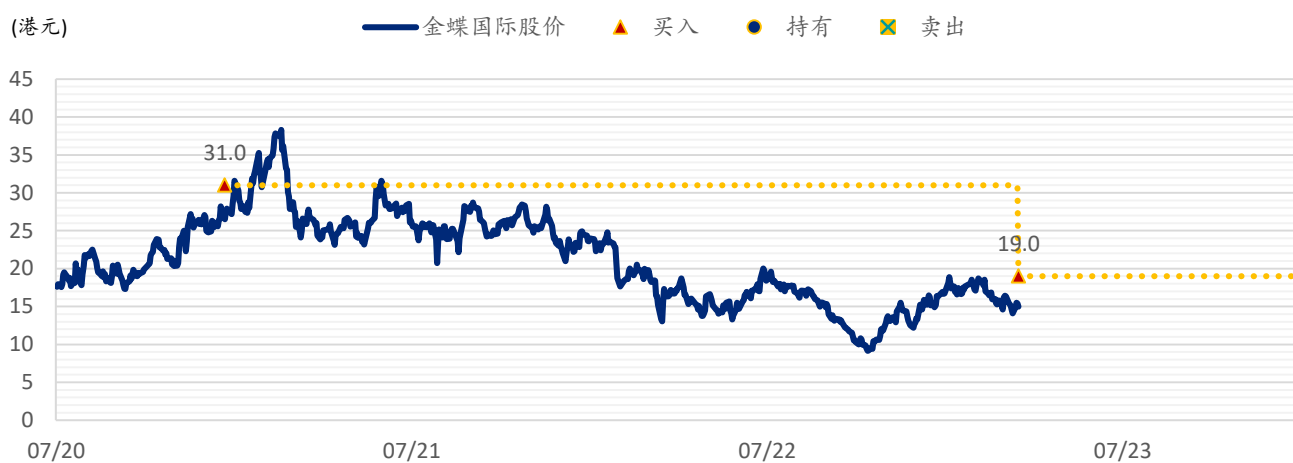
图表 2: SPDBI 目标价: 金蝶国际