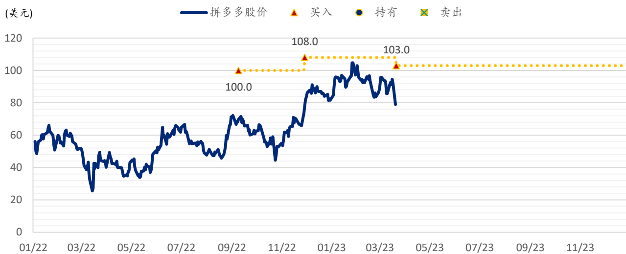
图表 2：浦银国际目标价：拼多多（PDD.US）