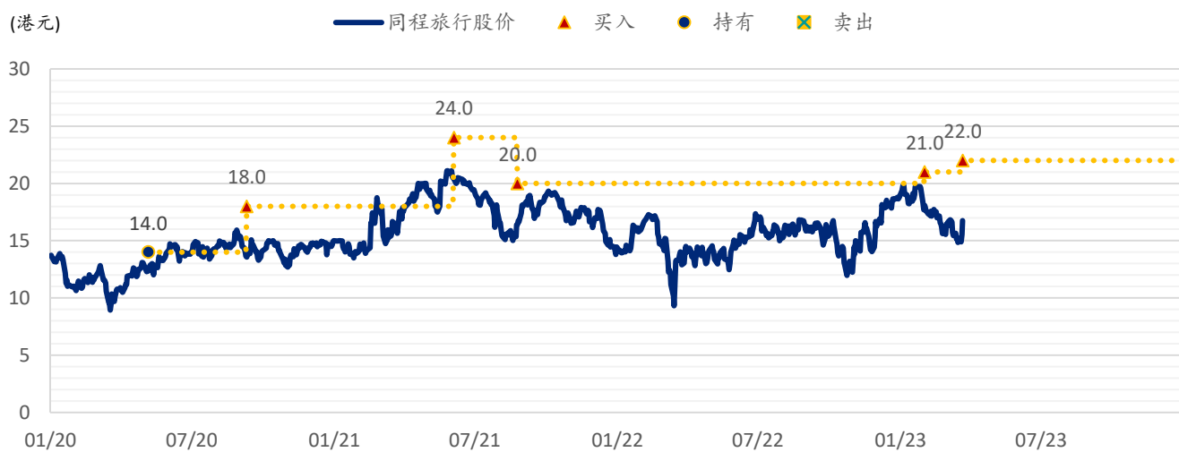
图表 2: SPDBI 目标价: 同程旅行