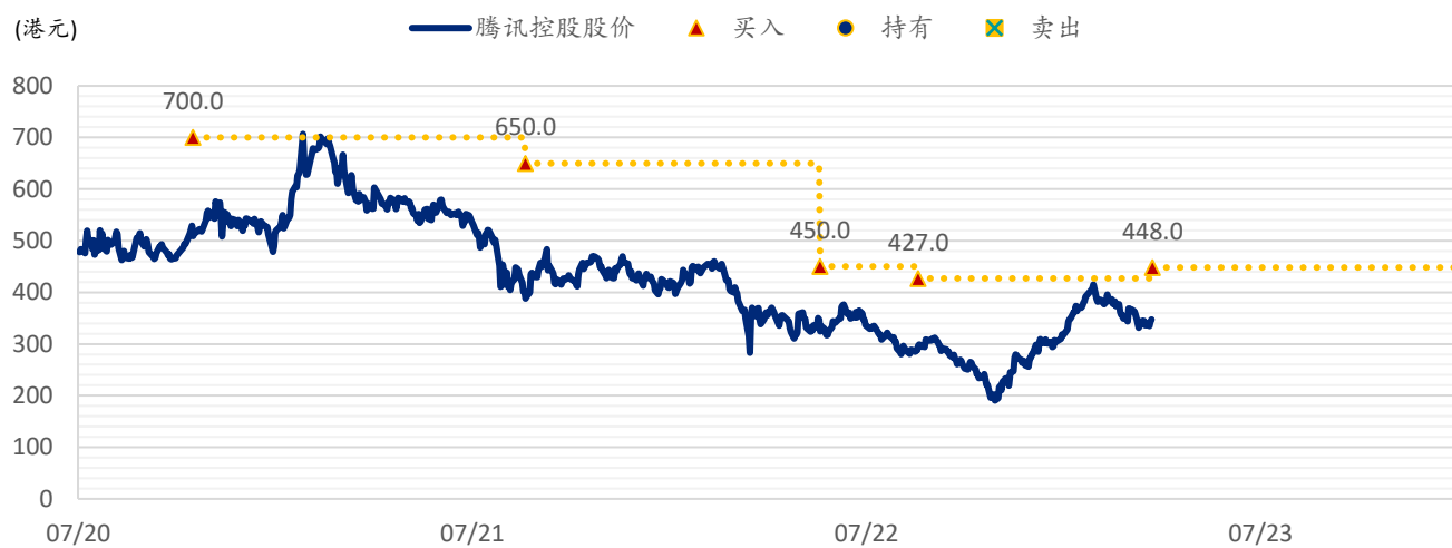
图表 2：浦银国际目标价：腾讯