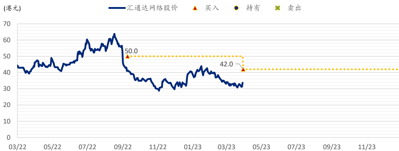
图表 2：浦银国际目标价：汇通达 (9878.HK)