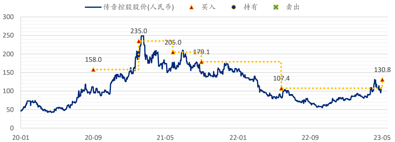
图表 8: SPDBI 目标价: 传音控股

注: 截至 2023 年 4 月 28 日收盘价