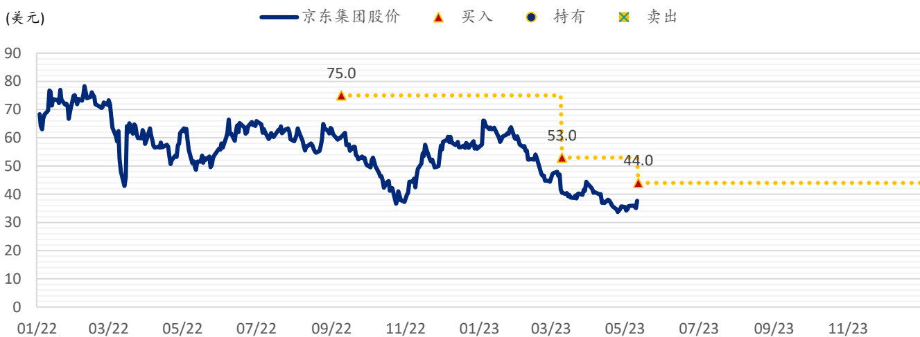
图表 3：浦银国际目标价：京东（JD.US）

注：截至 2023 年 5 月 11 日收盘