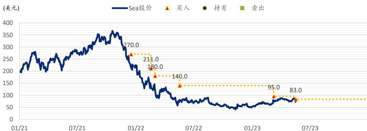
图表 3: SPDBI 目标价: Sea