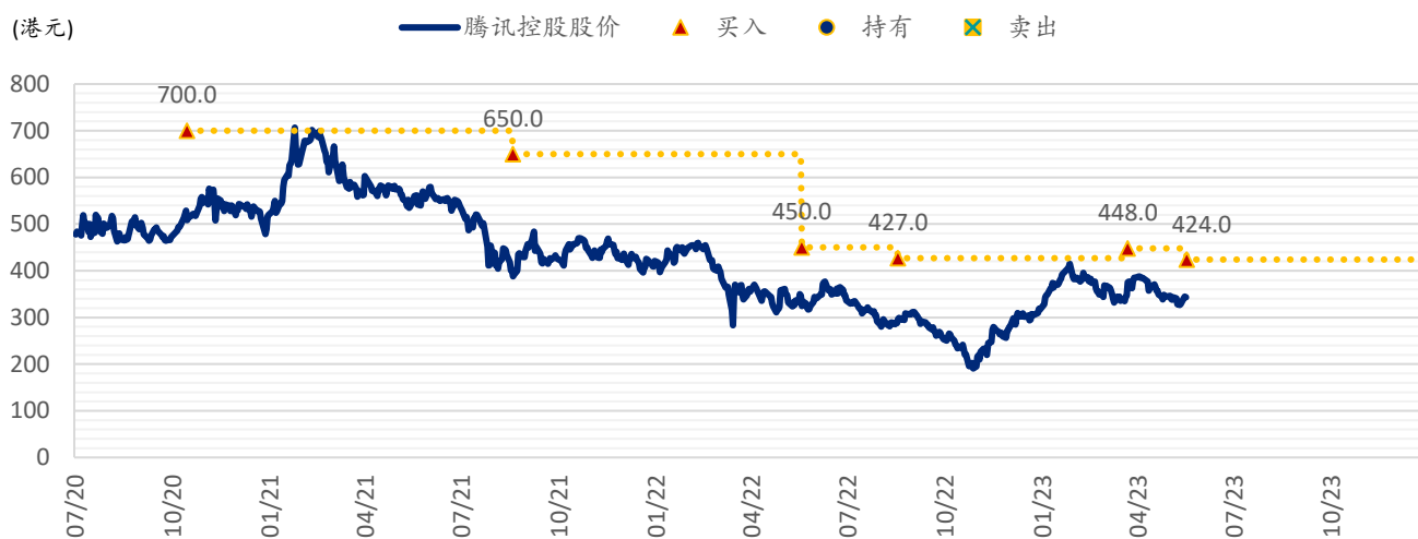
图表 2：浦银国际目标价：腾讯