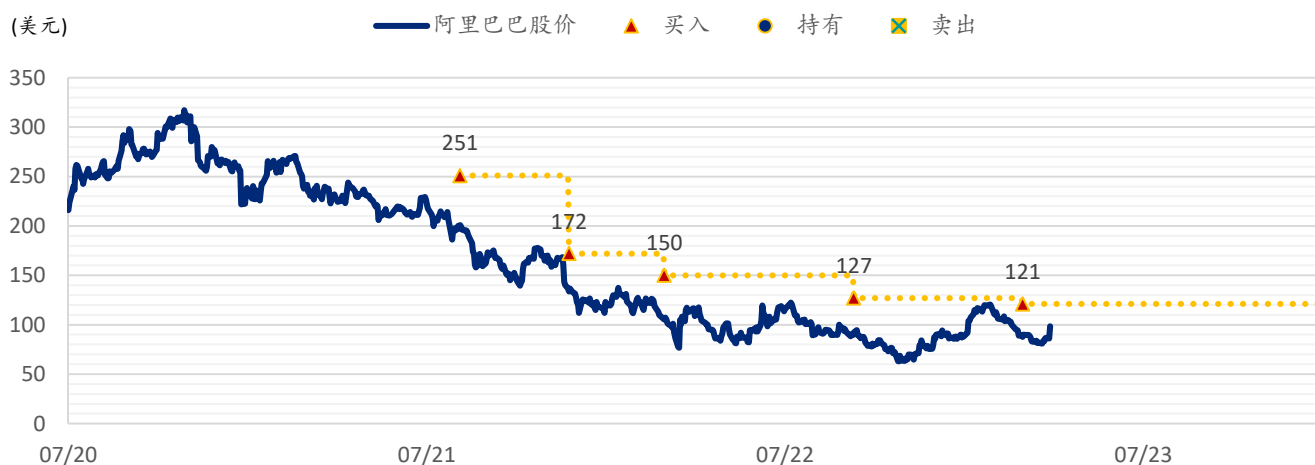
图表 5: SPDBI 目标价: 阿里巴巴 (BABA.US) — 美股