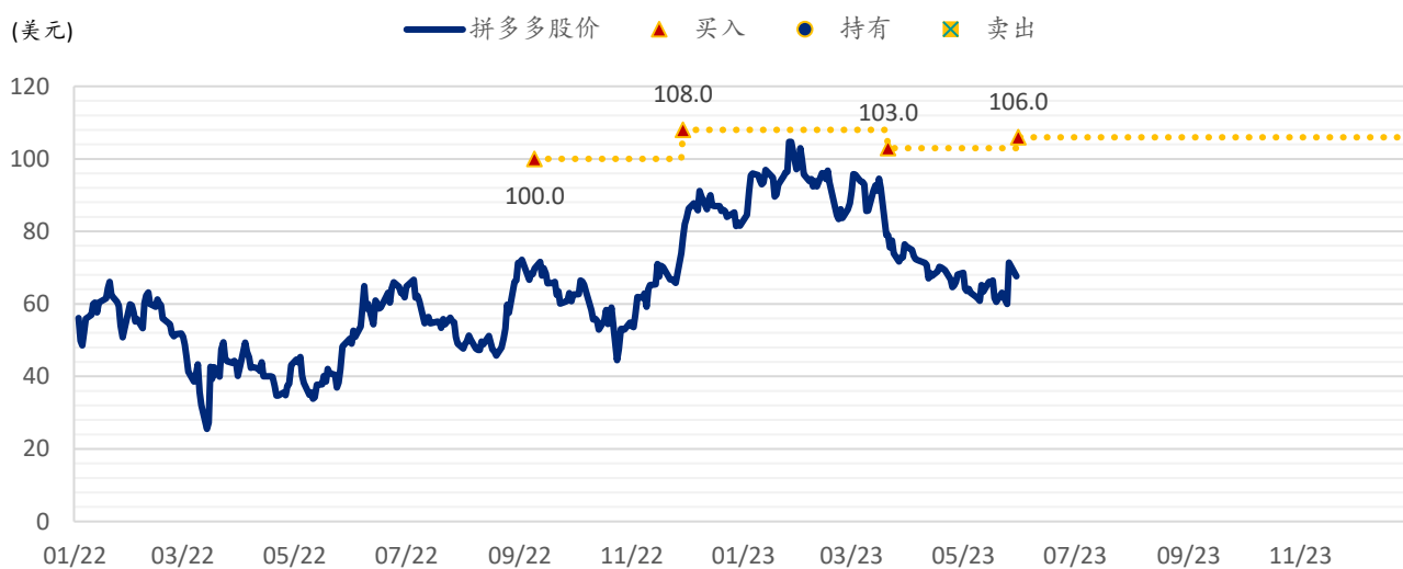
图表 2：浦银国际目标价：拼多多（PDD.US）