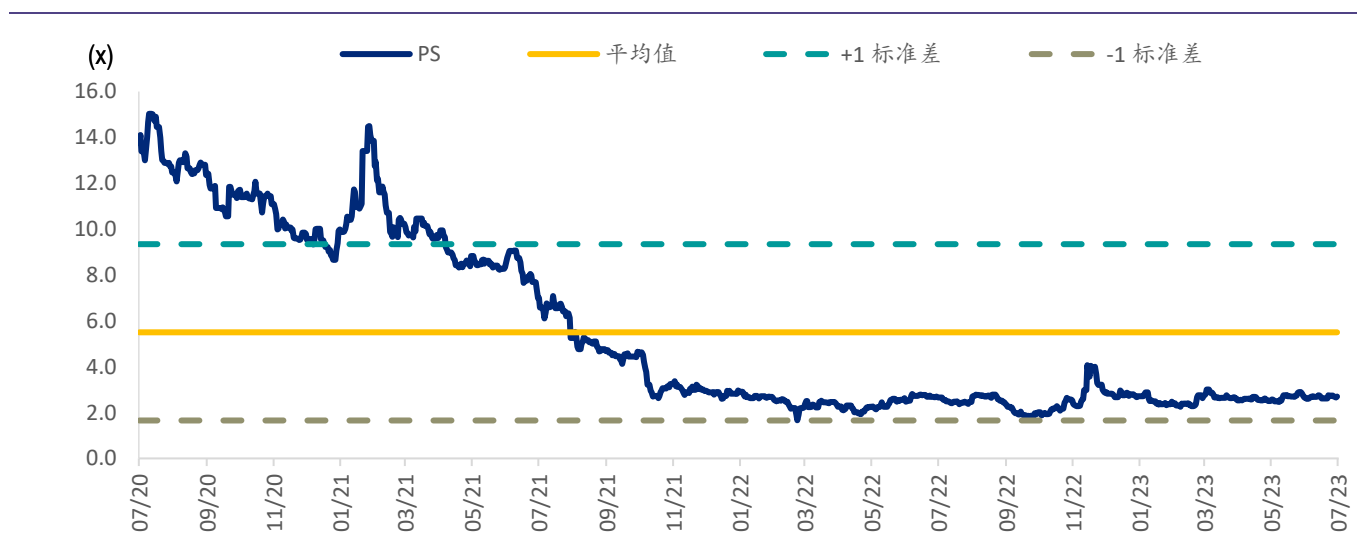
图表 3：平安好医生 PS Band