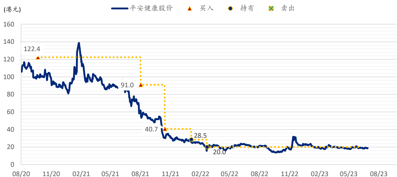
图表 5: SPDBI 目标价: 平安好医生