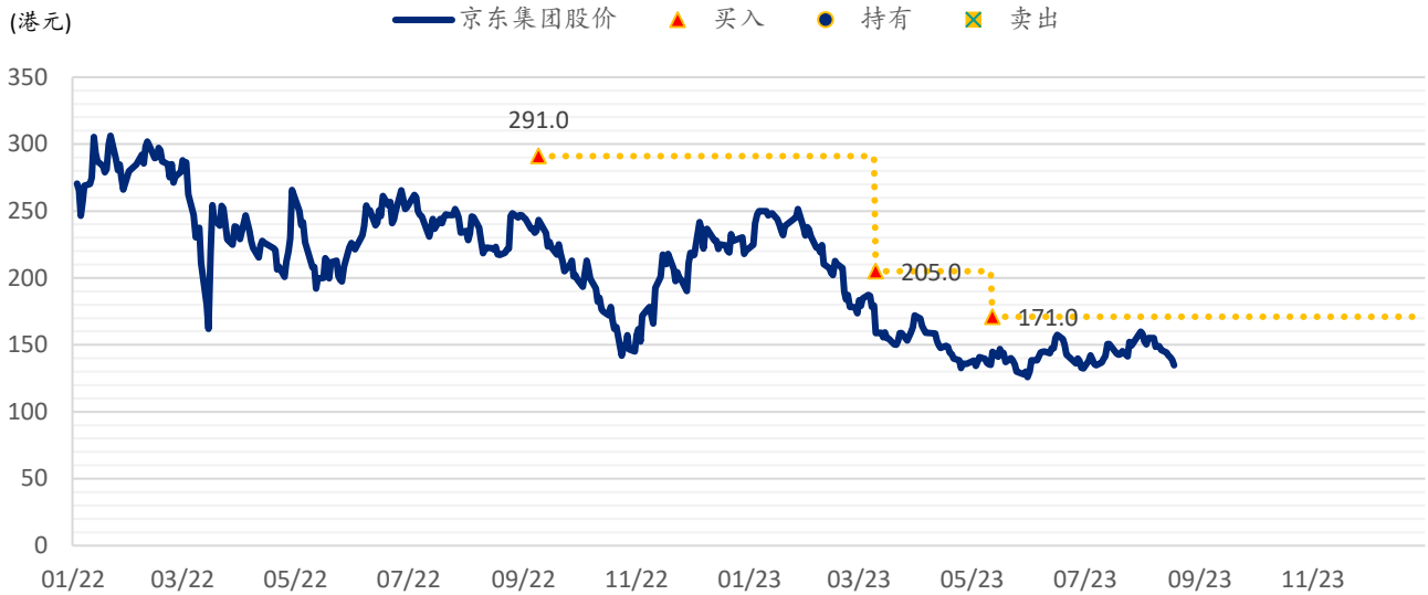
图表 2: 浦银国际目标价: 京东 (9618.HK)

注: 截至 2023 年 8 月 17 日收盘