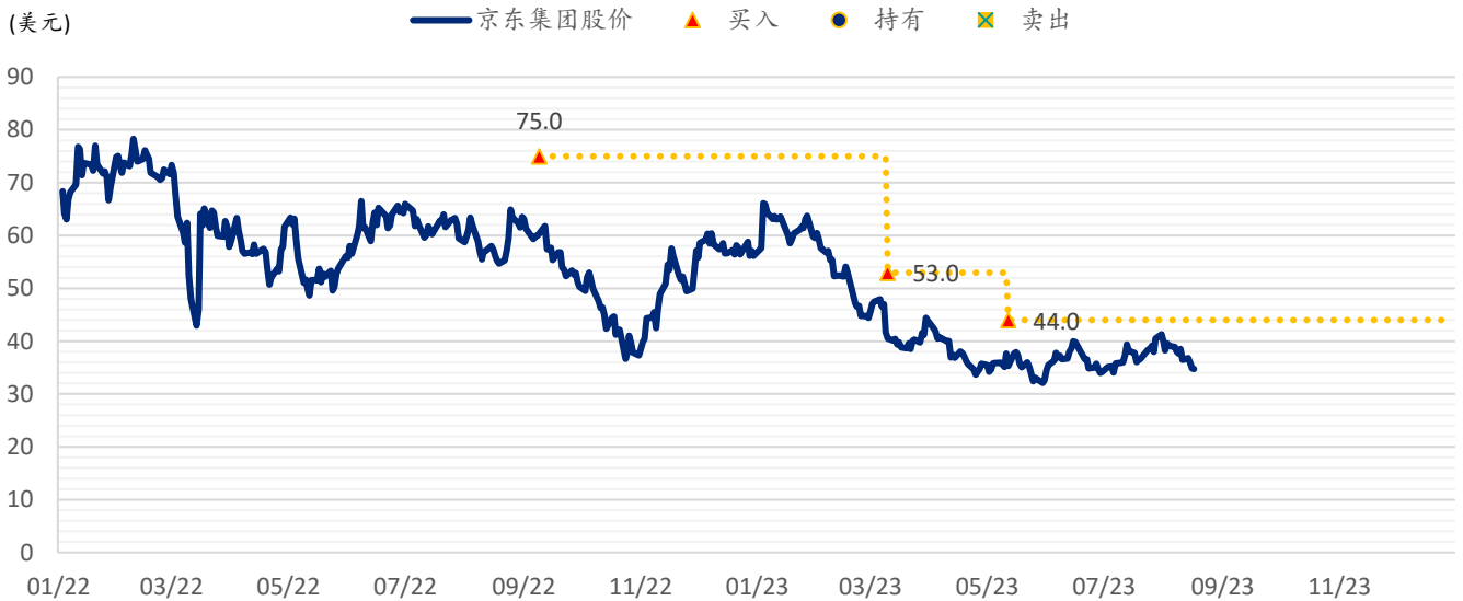
图表 3: 浦银国际目标价: 京东 (JD.US)

注: 截至 2023 年 8 月 17 日收盘