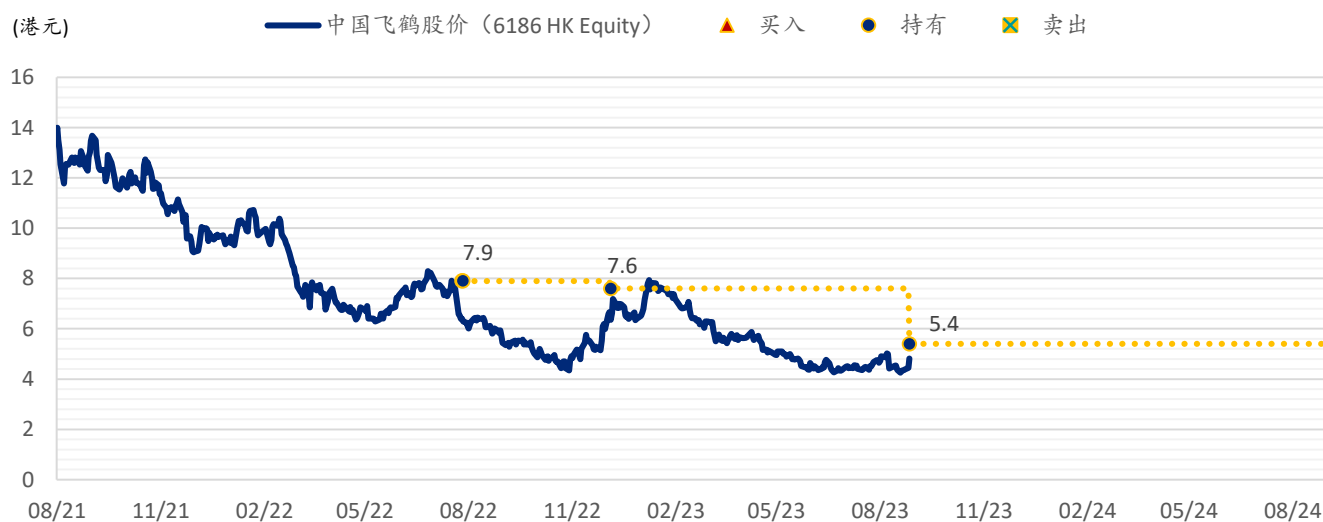
图表 3: SPDBI 目标价: 中国飞鹤 (6186.HK)