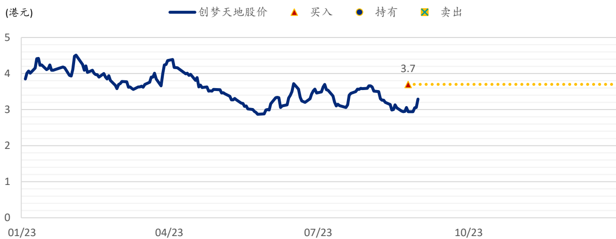
图表 2：浦银国际目标价：创梦天地（1119.HK）