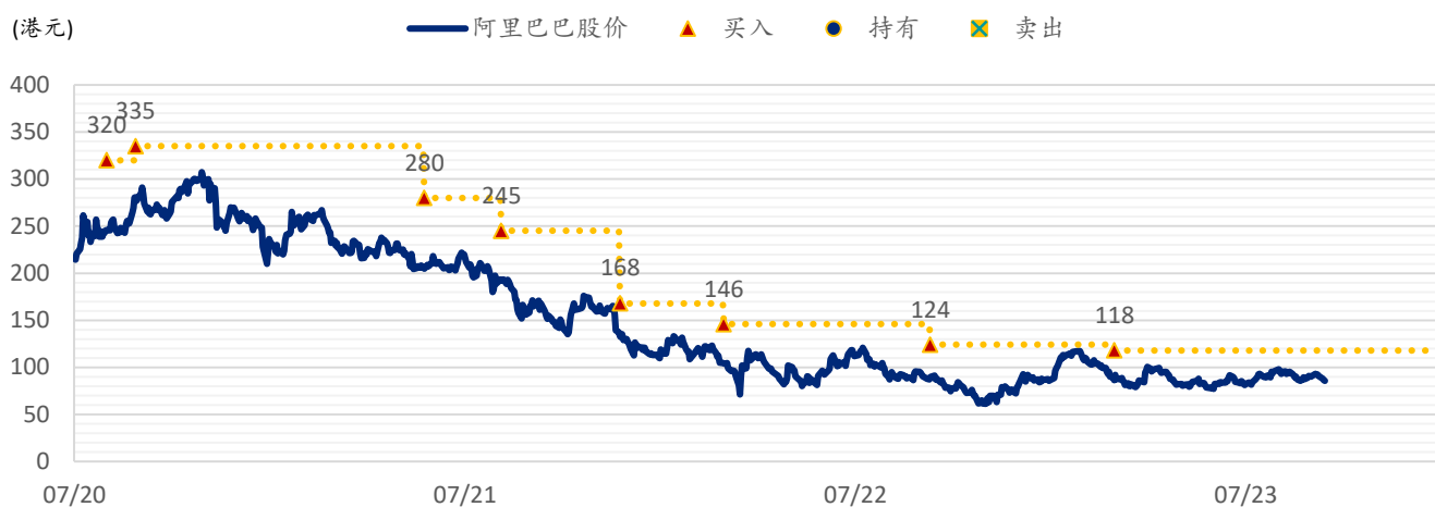
图表 2: SPDBI 目标价: 阿里巴巴 (9988.HK) — 港股