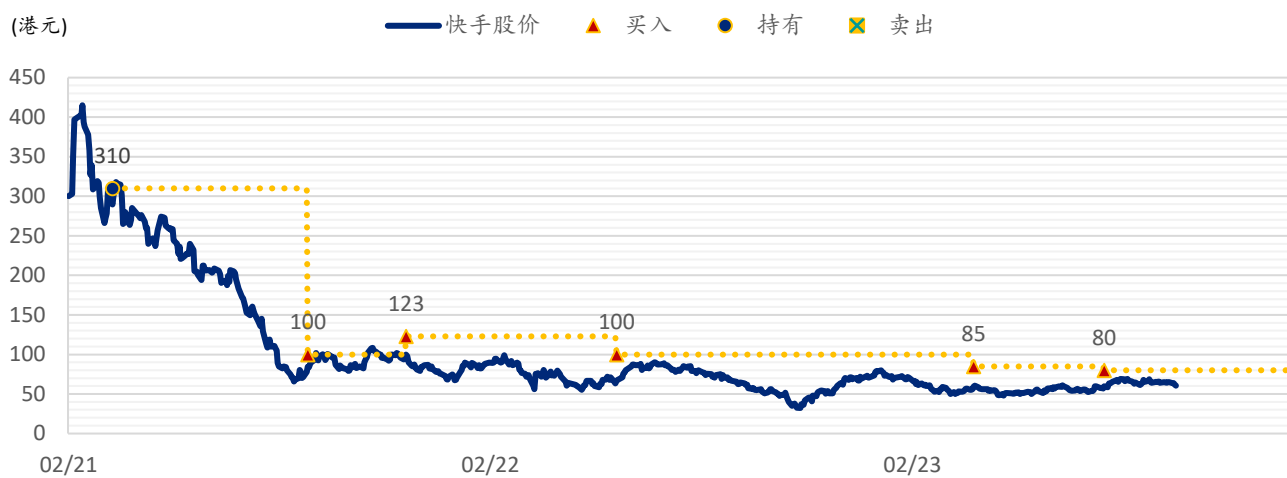
图表 2: SPDBI 目标价: 快手