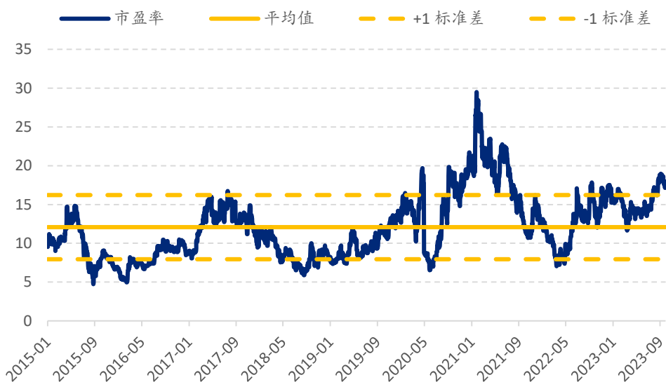
图表 4: 比亚迪电子市盈率估值 (x)