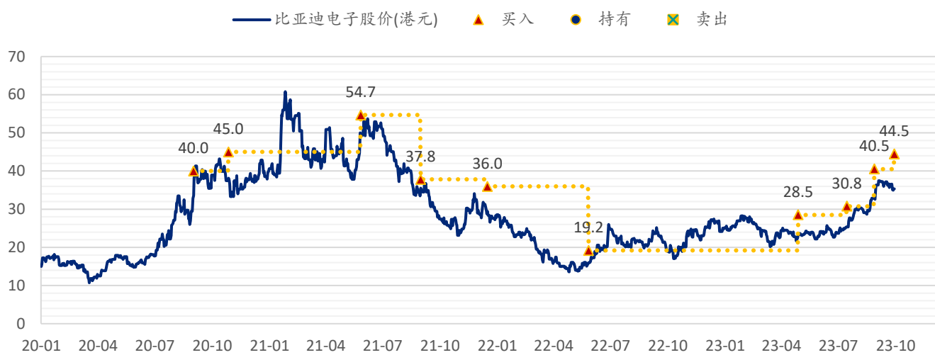
图表 5: SPDBI 目标价: 比亚迪电子 (285.HK)