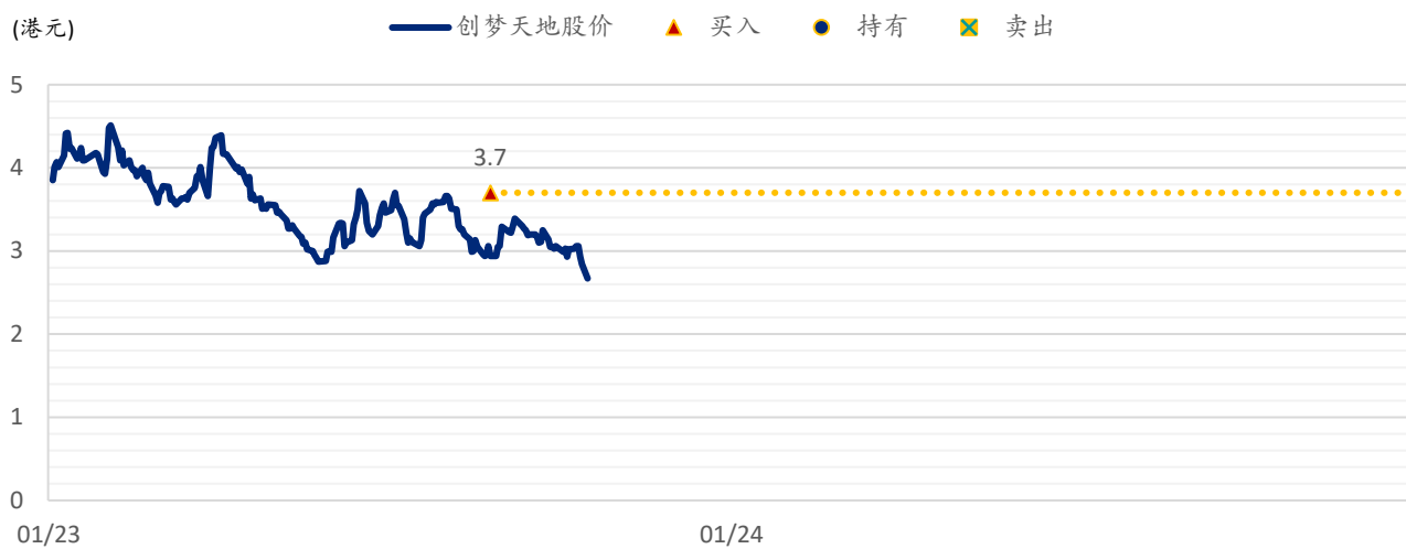
图表 2：浦银国际目标价：创梦天地（1119.HK）