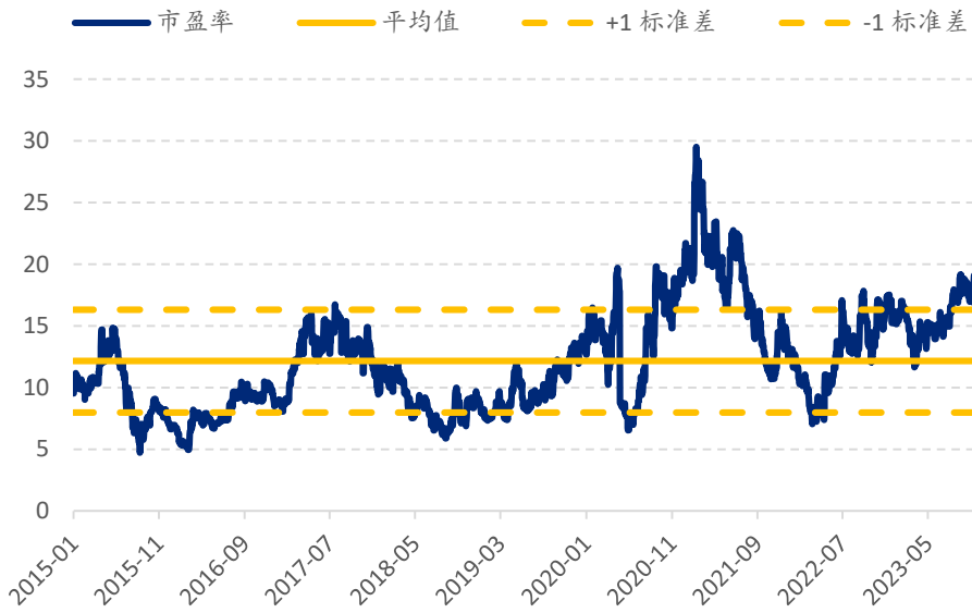
图表 2: 比亚迪电子市盈率估值 (x)