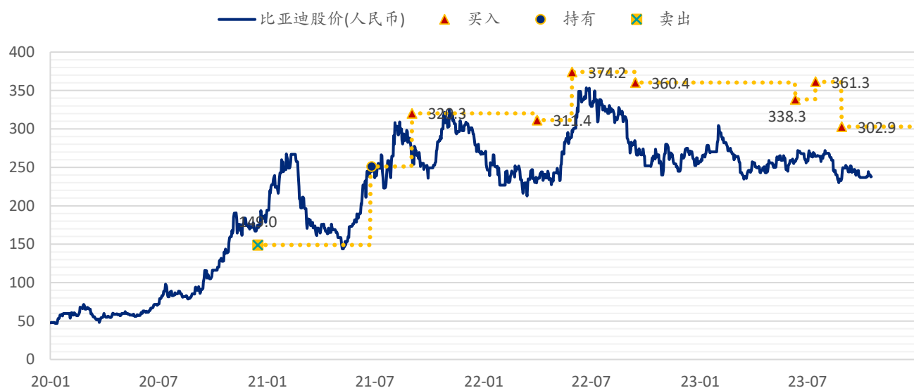
图表 5：浦银国际目标价：比亚迪（002594.CH）

注：截至 2023 年 10 月 17 日收盘价