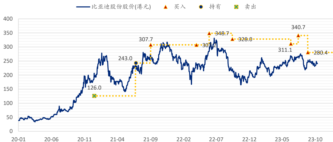
图表 4：浦银国际目标价：比亚迪股份（1211.HK）

注：截至 2023 年 10 月 17 日收盘价