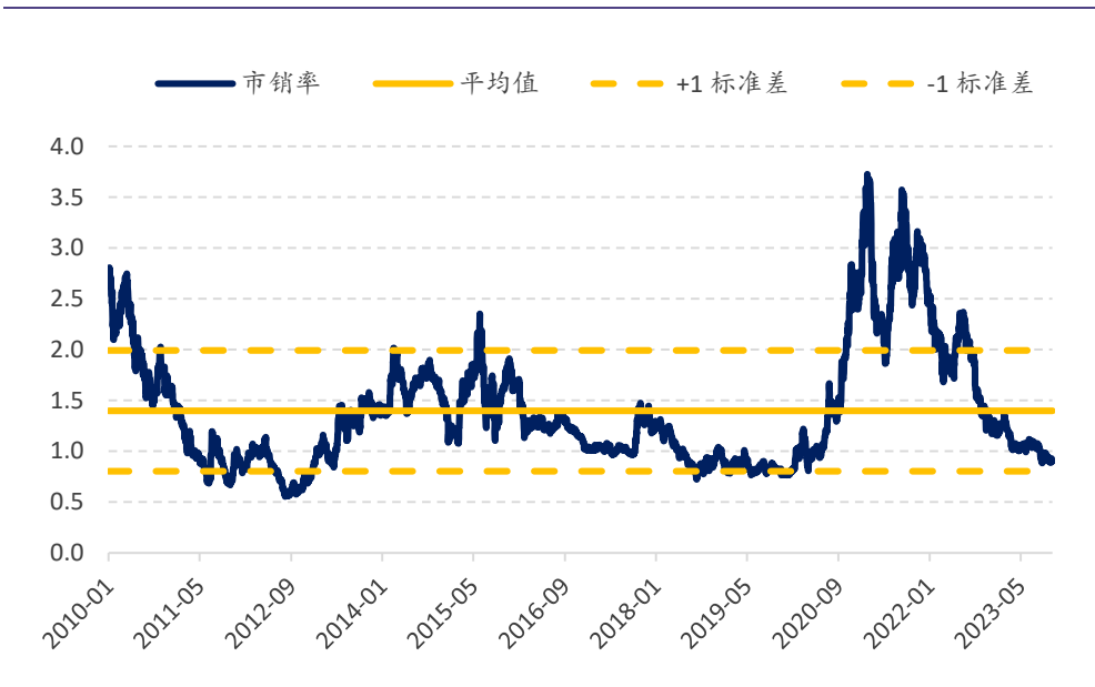
图表 2：比亚迪股份历史市销率：当前估值 0.9x vs 2010 年以来均值 1.4x

注：截至 2023 年 10 月 17 日收盘价； 资料来源：Bloomberg、浦银国际