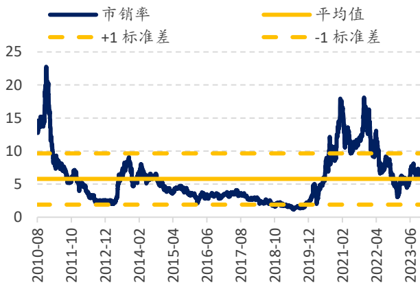
图表 3: 特斯拉市销率 (x) 估值