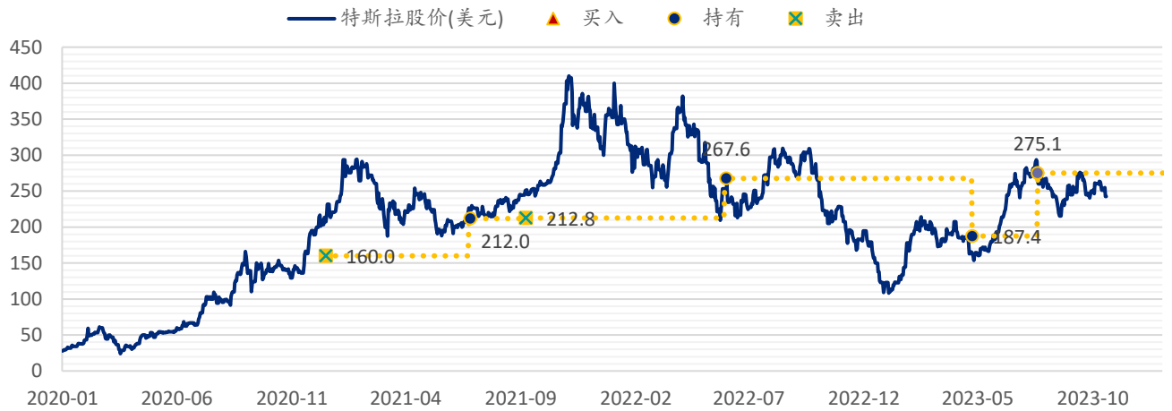
图表 5: SPDBI 目标价: 特斯拉