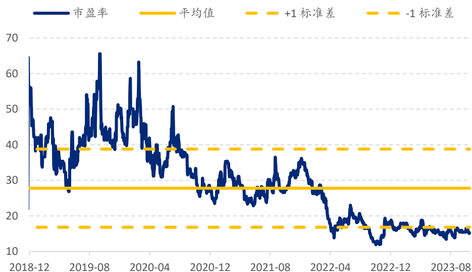
图表 4：闻泰科技市盈率估值 (x)