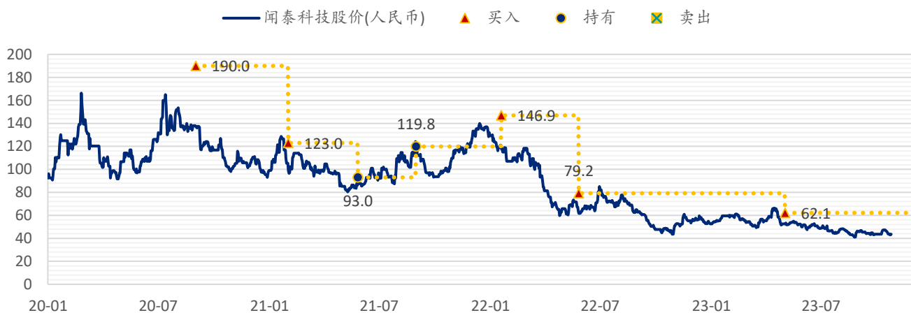
图表 5：SPDBI 目标价：闻泰科技 (600745.CH)