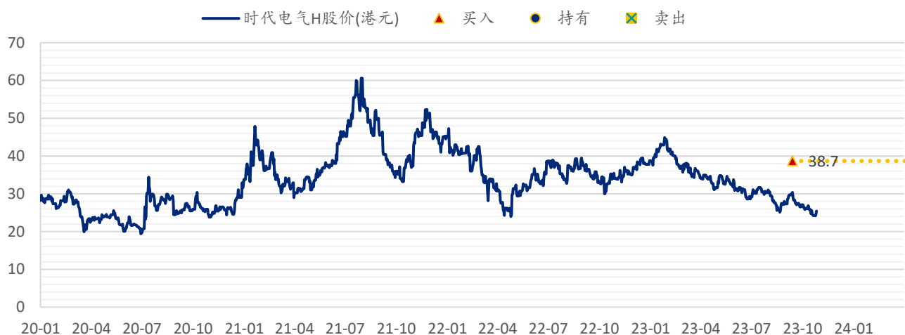
图表 6: SPDBI 目标价: 时代电气 H 股 (3898.HK)