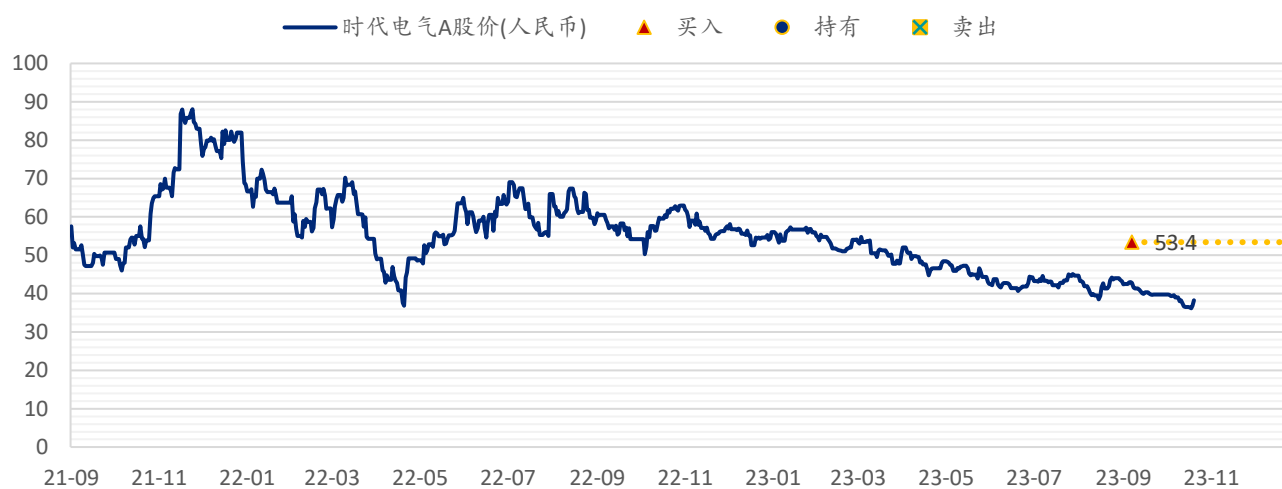
图表 5: SPDBI 目标价: 时代电气 A 股 (688187.CH)