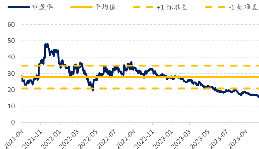
图表 2：时代电气 A 股历史 PE：上市以来均值 27.8x