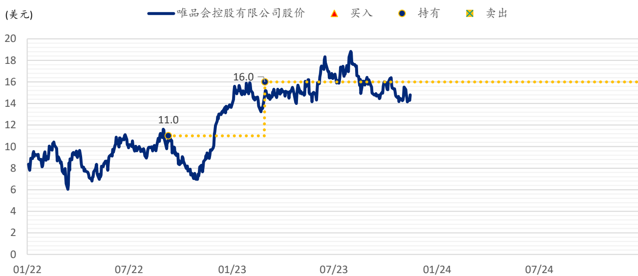
图表 2：浦银国际目标价：唯品会（VIPS.US）