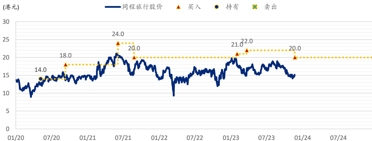
图表 2: SPDBI 目标价: 同程旅行